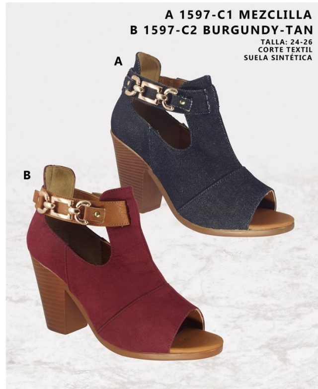
A 1597-C1 MEZCLILLA B 1597-C2 BURGUNDY-TAN TALLA: 24-26 CORTE TEXTIL SUELA SINTÉTICA