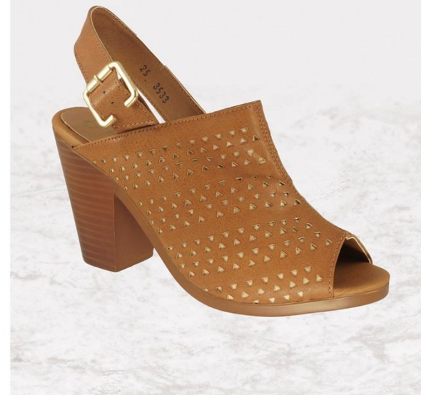
15107-C3 BLANCO TALLA: 24-26 CORTE SINTÉTICO SUELA SINTÉTICA