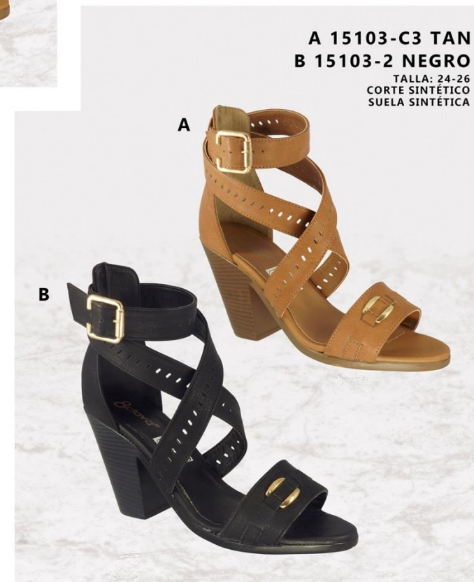
A 15103-C3 TAN B 15103-2 NEGRO TALLA: 24-26 CORTE SINTÉTICO SUELA SINTÉTICA