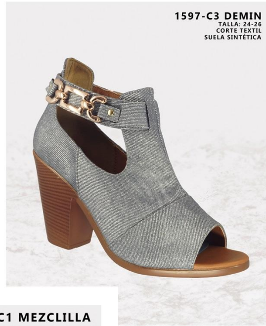
1597-C3 DEMIN TALLA: 24-26 CORTE TEXTIL SUELA SINTÉTICA