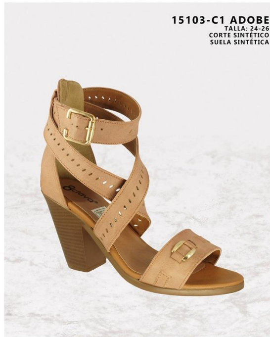
15103-C1 ADOBE TALLA: 24-26 CORTE SINTÉTICO SUELA SINTÉTICA